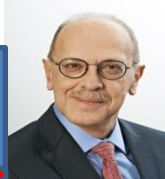
Farid Aractingi Presidente ECIIA "Internal Audit, a major player in good governance, in view of sustainable performance"