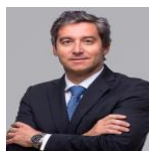
Pedro Vidigal Monteiro Telles de Abreu Advogados